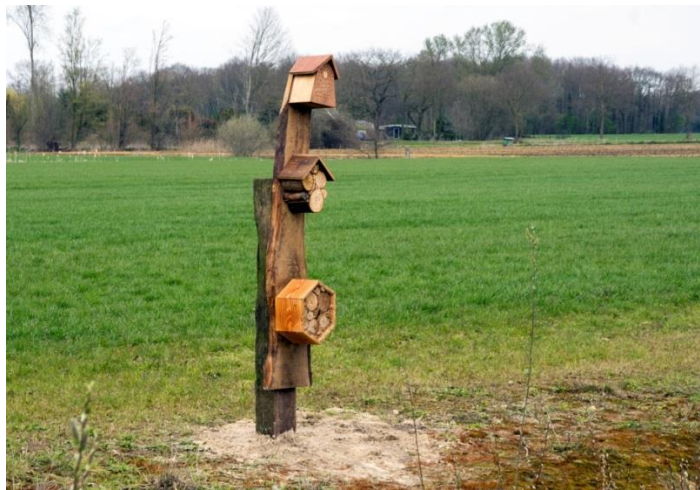
Hofvogels plaatst een bijentotem in Hengevelde aan retentievijver van het bedrijventerrein

In Hengevelde hebben de eerste twee bedrijven een donatie gedaan en zich verbonden aan biodiversiteitsdoelen via Hofvogels/Natuurerf . Daarom is een 'bijen-totem' geplaatst bij de retentievijver naast het bedrijventerrein in Hengevelde