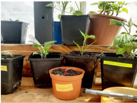
Entree Reggetuin Kerkstraat 123 D (achter Avia Tankstation) in Goor.

Ontvang op 22 mei in Markelo een bessenstruik om op te kweken en dien je idee in voor de Struikenactie via de Groene Loper.